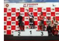
Sieg für Maurice Ullrich

MX KTM KINI GmbH, Bradl 319, 6210 Wiesing MX Sportsline GmbH, Bradl 319, 6210 Wiesing